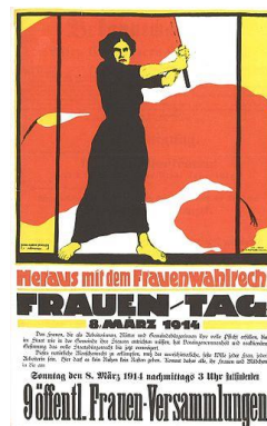
Plakát ženského hnutí za volební práva žen, 8. března 1914

V Evropě byl den žen jako mezinárodní svátek zaveden v roce 1910 na konferenci žen v Kodani na návrh Kláry Zetkinové jako připomínka demonstrací za lepší podmínky žen v USA. Od roku 1911, kdy byl poprvé slaven v Německu, Rakousko-Uhersku, Švýcarsku a Dánsku, mezi jeho hlavní cíle patřilo volební právo žen. Datum 8. března se ustálilo až po 1. světové válce, zejména pod vlivem velké demonstrace žen v Petrohradě roku 1917 (těsně předcházející únorové revoluci), která se konala poslední neděli v únoru dle juliánského kalendáře, což odpovídá 8. březnu kalendáře gregoriánského. Svátek se rychle rozšířil, jeho obsah kolísal od politického a feministického protestu po apolitickou socialistickou obdobu Dne matek. Oficiálně tento den uznala OSN v roce 1975 a stanovila jeho datum na 8. březen.