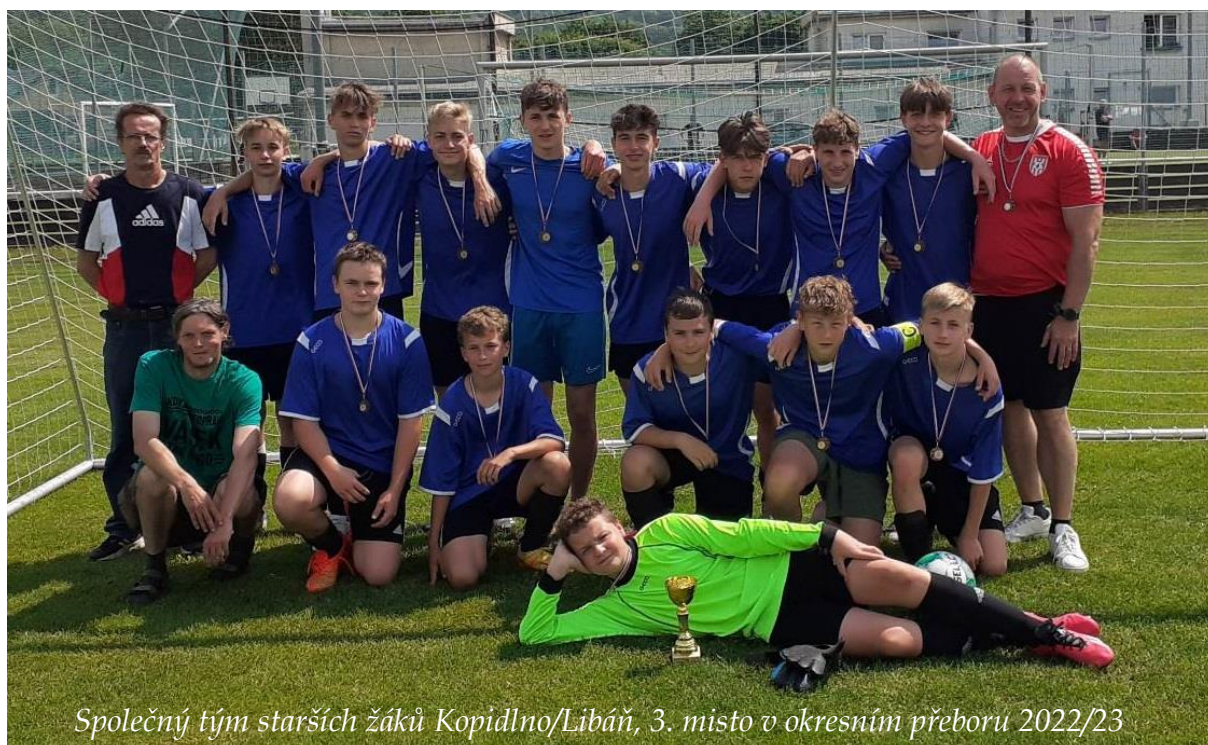
Společný tým starších žáků Kopidlno/Libáň, 3. místo v okresním přeboru 2022/23

Léto uteklo jak voda, blíží se podzim a s tím i start nového ročníku fotbalových soutěží. Do sezóny 2023/2024 vstupuje TJ Sokol Libáň se čtyřmi týmy. Tým dospělých opět působí v okresním přeboru, v úvodním kole jsme v domácím prostředí přehráli Nemyčeves 3:0. V dalším utkání jsme ale nepochopitelně polevili a proti nováčkovi z Jičíněvsi jsme po mdlém výkonu padli 1:4, navíc v nervózním závěru byli vyloučeni dva klíčoví hráči, kteří díky následnému trestu dostali stop na