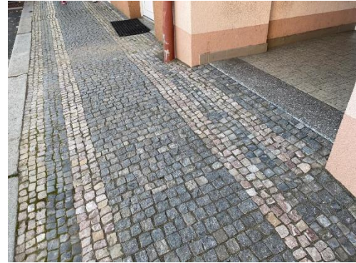
bariérový vstup z náměstí do zdravotního střediska.

Stará budova základní školy dostala nová okna s trojitými skly. Jsem opravdu zvědav na to, jakou skutečnou úsporu energií to bude po letošní zimě znamenat.