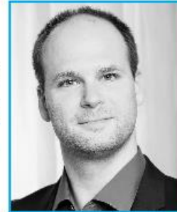
MARTIN SLAVÍK tenor